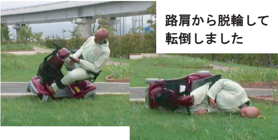
路肩から脱輪して転倒しました

操作ミスによる死亡・重傷事故が多発しています。特に購入時や代車、レンタル時は十分に練習を行ってください。傾斜した路肩や未舗装の畦道、砂利道など悪路走行をしないでください。スリップしたり制御不能になるなど危険です。坂道でクラッチを切らないでください。スピードが加速し、ブレーキがきかなくなります。取扱説明書に従って正しく使用してください。